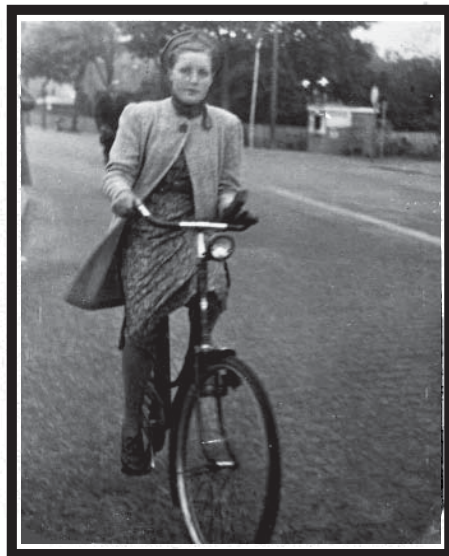
"Yngst fra Højet"